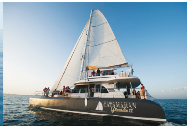
Découverte du vivant organise des sorties en mer, depuis La Grande-Motte et Canet-en-Roussillon, pour observer oiseaux et mammifères marins.